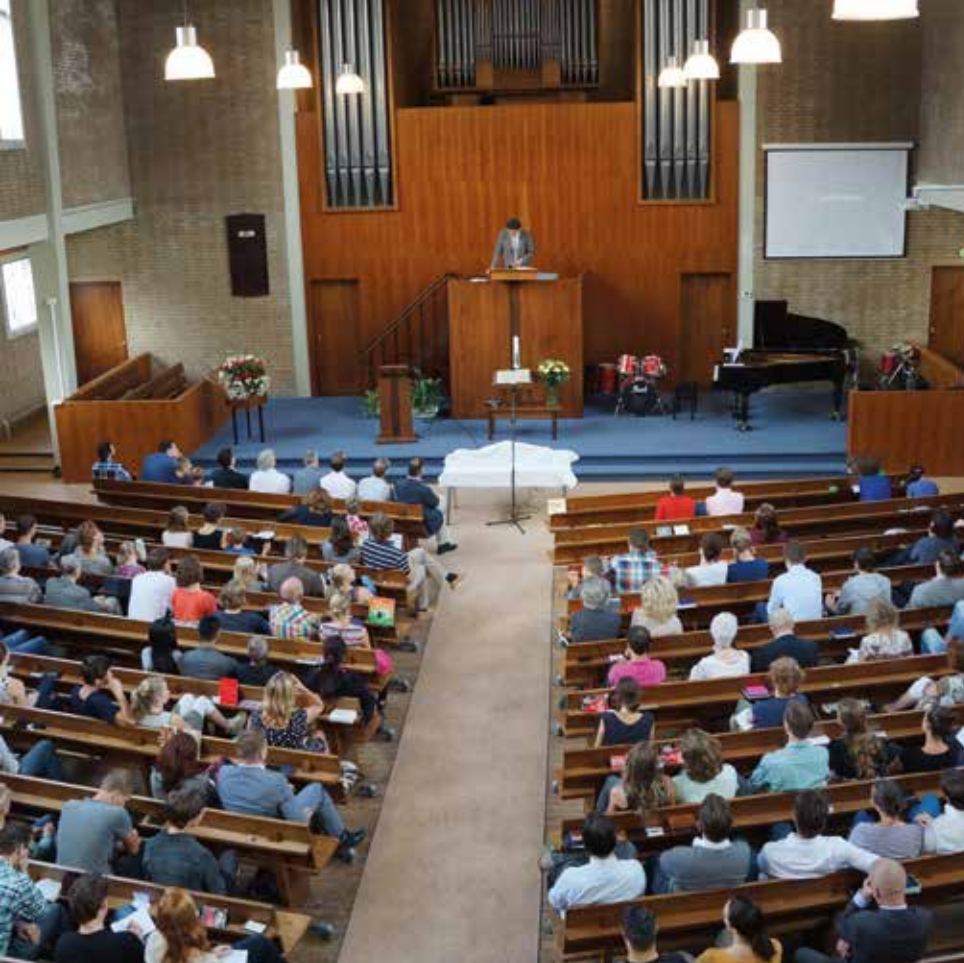
Deze vorm van het gemeentegebed past bij het spontane karakter van de gemeente van Rotterdam-Delfshaven, maar het is meer dan een plaatselijke variant in de liturgie ///

zoals Jezus daarover spreekt. Onderling vertrouwen is nodig, omdat je je kwetsbaar opstelt; dat moet je durven, de situatie moet dat toelaten. Maar onderling vertrouwen groeit ook door deze gebedspraktijk. Dat kun je goed merken aan de kinderen. Ik vind het prachtig als een kind z'n vinger opsteekt om te zeggen dat 'ie jarig is. Of een ander kind dat 'ie gisteren een voetbaltoernooi heeft gewonnen. Zij weten dat ze erbij horen. Mensen die onze gemeente voor het eerst bezoeken valt het op: ze geven aan dat ze de onderlinge betrokkenheid en openheid opmerken en waarderen. Meestal is het gemeentegebed omringd met gezang. We openen ons gebed zingend richting de Heer. En we sluiten het gebed zo af in de verwachting dat Hij ermee verder gaat, verder dan wij kunnen vermoeden, bijvoorbeeld met Liedboek 95: 'Hem nu die in ons werkt